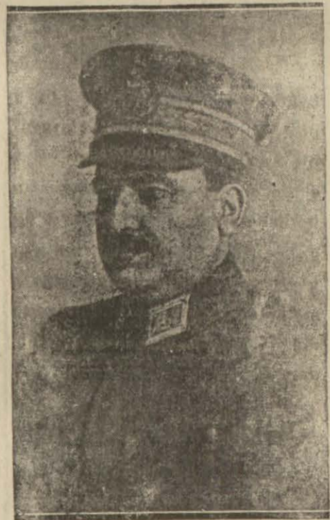
30 Ağustos zaferinin büyük kahramanlarından Mareşal Fevzi Çakmak

Polonya işlerinin adilâne tesviyesini hükümeti kraliyeye istemektedir. Polonyaya karşı taahhütlerimiz ve ittifak muahedemizi icra etmek mecburiyetinde bulunduğumuzu biliyoruz. Hitlerin notamıza vereceği cevabı bekliyoruz. Harpmi olacak, sulh mu olacak bu hususta verilmiş bir karar yoktur. Biz halâ sulh için çalışıyoruz. Kuvvetimizin zafa uğramasına müsaade etmeyeceğiz. Demistir. Bundan sonra muhalif işçi ve liberal parti liderleri söz almışlar ve İngiliz milletinin sarsılmaz azmini teyit etmişlerdir. İngiliz-Polonya muahedesi sinin metni parlamento azalarna tevzi edilmiştir. Avam kamarası icabında tekrar davet edilebilmek üzere önümüzdeki hafta salı gününe kadar tatil edilmiştir.